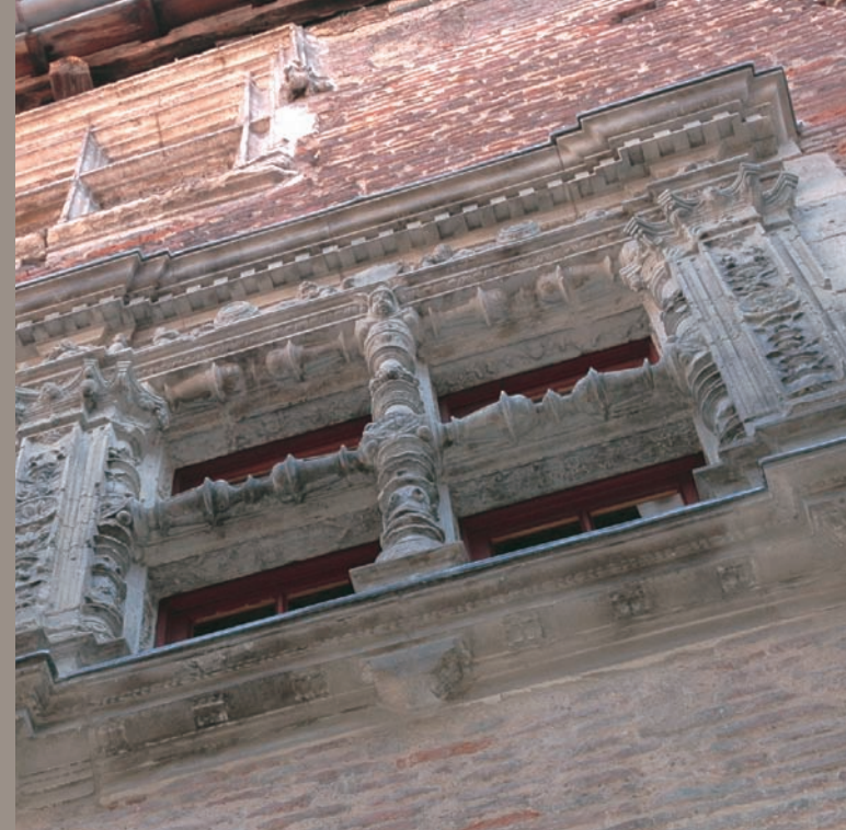
CLÉMENT MAROT (CAHORS, 1496 - TURIN, 1544)

Le jeune public est initié au patrimoine local tout au long de l'année. Le temps scolaire est ponctué de visites en ville, d'interventions dans les établissements ou d'accueils à la Maison de l'Eau, appuyés sur des questionnaires adaptés à l'âge des enfants et aux souhaits de l'enseignant. Parmi les animations ouvertes aux enfants durant les vacances, figurent notamment : en juillet-août, « l'été des 6-12 ans », dont les thématiques valorisent les différentes facettes du patrimoine de la ville et, durant les petites vacances scolaires, des ateliers animés par un artisan sont proposés.