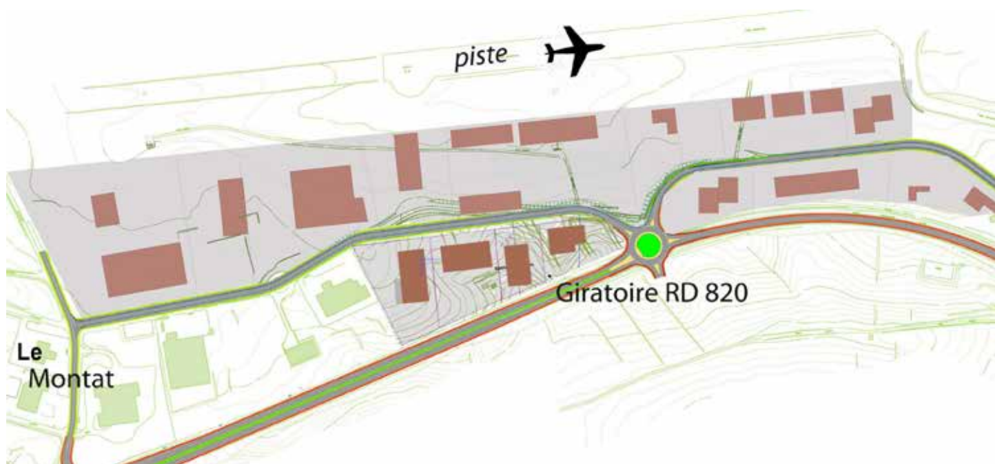
Cap del Bos 1 et 2

A noter que pour les autres zones, une étude devrait être lancée prochainement pour déterminer précisément les débits disponibles zone par zone et donc identifier ce qu'il reste à améliorer pour assurer une bonne desserte des entreprises à court terme.