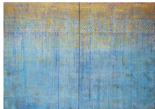
Béatrice Casadesus, Infinito 1 (2008), acrylique sur toile.