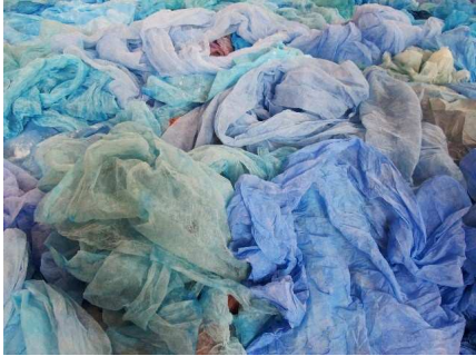
Béatrice Casadesus, Mues de peinture (2010), acrylique sur intissé