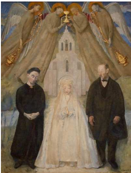
Edmée Larnaudie, La Communiante (1939), huile sur toile.