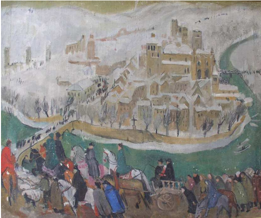
Edmée Larnaudie, Le Dénombrement de Bethléem (1937), huile sur toile.