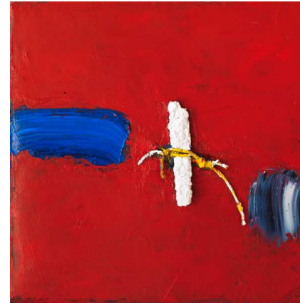
André Nouyrit, Sans titre , huile sur toile