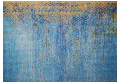
Béatrice Casadesus, Danaë (2009), acrylique sur toile.