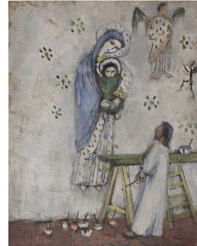
Edmée Larnaudie, Le Peintre (vers 1940), huile sur toile.