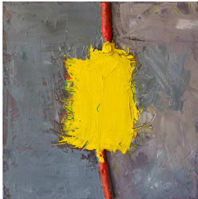
André Nouyrit, Sans titre , huile sur toile