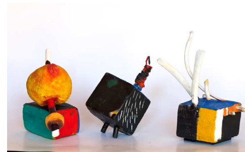
André Nouyrit, Trois petites sculptures , technique mixte