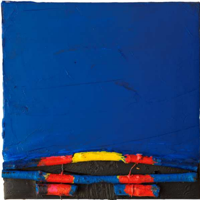
André Nouyrit, Sans titre , huile sur toile